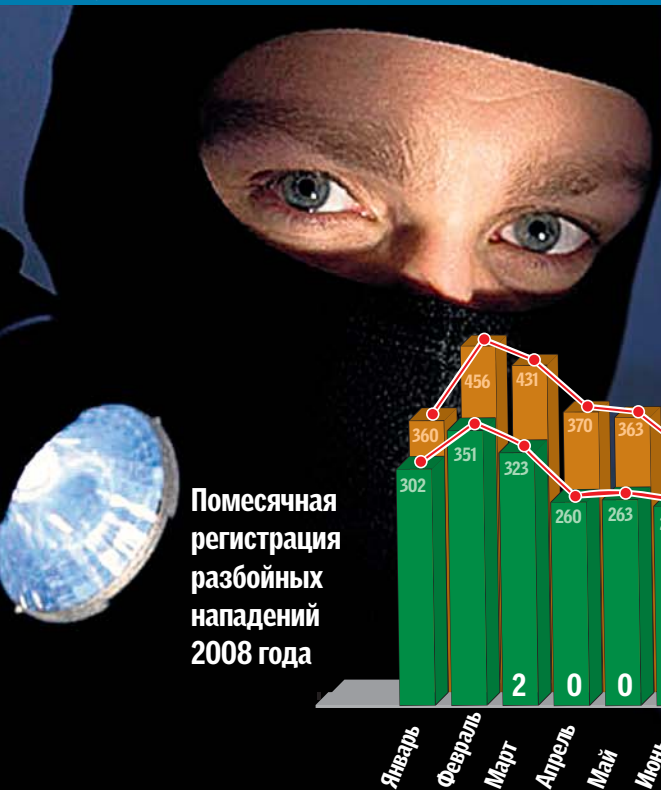
Помесечная регистрация разбойных нападений 2008 года

Экономический коллапс заставил криминальный мир менять структуру, методы и частоту совершения преступлений как профессионалами, так и дилетантами из числа потерявших работу