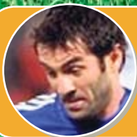
ГЕОРГИОС КАРАГУНИС 32 года, «Панатинаикос»