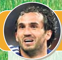
ТЕОФАНИС ГЕКАС 29 лет, «Байер» (Германия)

Уроженец Закарпатья, ставший чемпионом СССР в «Спартаке» и вице-чемпионом Европы-88 со сборной, сейчас тренирует аматорскую команду в Германии и является консультантом немецкого тренера сборной Греции Отто Рехагеля