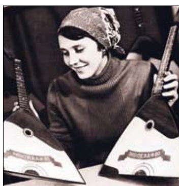
Сувениры с фабрики в Чернигове

В олимпийскую культурную программу в Киеве были вовлечены 17 музеев, 7 библиотек, 6 кинотеатров и т.д. Экраны были насыщены спортивной тематикой, вроде фильма «Место спринтера вакантно» и конечно же, мультфильмов «Как казаки в футбол играли» и «Как казаки олимпийцами стали».