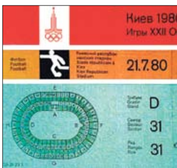
Билет на футбольный поединок киевского турнира

■ Киев вместе с Минском принимал матчи двух групп плюс четвертьфинал. Всего на Республиканском сыграли семь поединков (их посетило 575,5 тыс. человек). В первом, собравшем 100 000 зрителей, разошлись миром ГДР и Испания (1:1). Другие: Ирак — Коста-Рика (3:0), ГДР — Алжир (1:0), Финляндия — Ирак (0:0), ГДР — Сирия (5:0), Финляндия — Коста-Рика (3:0). 1/4 финала: ГДР — Ирак — 4:0. В итоге базировавшиеся у нас немцы не пустили в финал СССР и завоевали олимпийское «серебро».