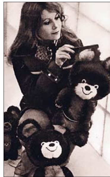
Любимый талисман: на въезде в Киев до сих пор стоят Мишки

■ Выдержки из «Отчета о проведении в Украинской ССР мероприятий Игр XXII Олимпиады...»: «Для приема и обслуживания участников и гостей Олимпиады было выделено 15 гостиниц и 28 общежитий на 20 740 мест. Футбольные команды были размещены в гостинице «Русь», а почетные гости, судьи и журналисты в гостинице «Днепр», для болельщиков построили «Братиславу». С 15 по 28 июля в гостиницах и общежитиях было принято и обслужено 44 305 человек, из них 24 781 советских туристов и 19 524 иностранных туристов, в том числе 3125 из капиталистических стран. За высокую культуру обслуживания записано 554 благодарности. Жалоб нет...»