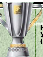
Суперкубок Украины — 3 (2005, 2008, 2010)