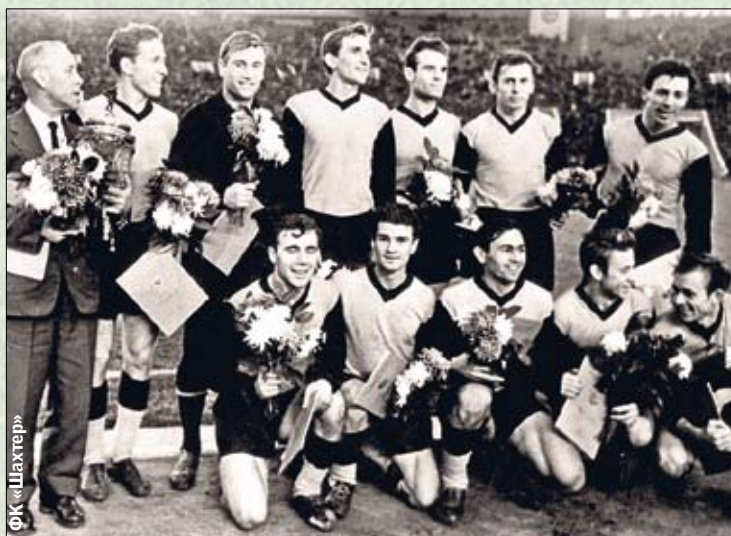
Первый трофей. В 1961 году «Шахтер» впервые завоевал Кубок СССР