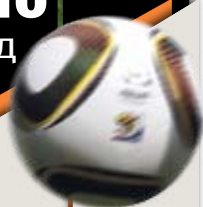
Выход в 1/4 Лиги Чемпионов... И снова чемпионы Украины!