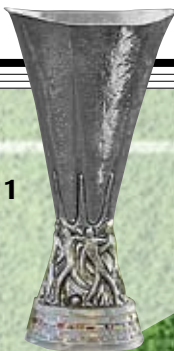
Кубок УЕФА — 1 (2009)