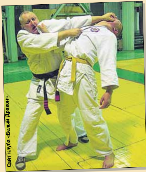
Сайт клуба «Белый Дракон»