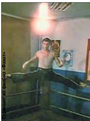
Скриншот из фильма «Фанат»